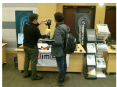
URAI2012 Nov.26~29, 2012